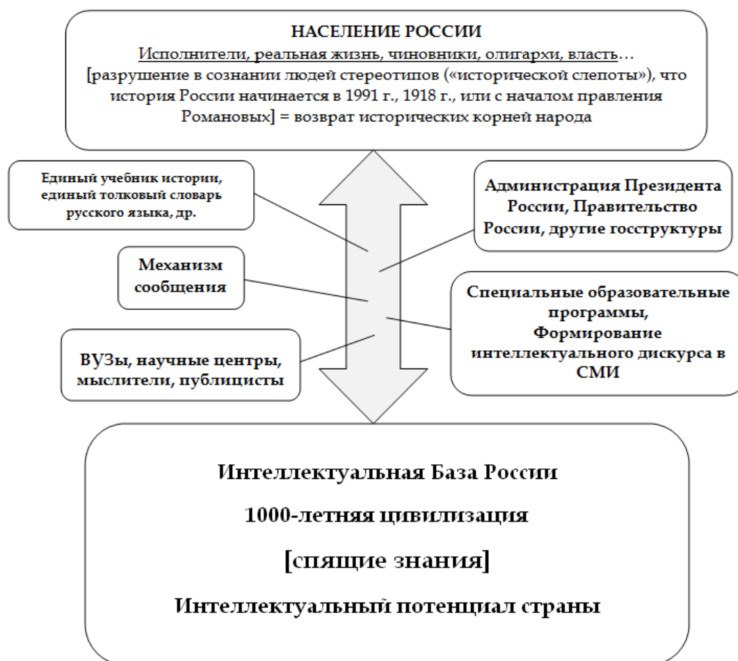
Рис. 2. Связка «Накопленные знания России – Интеллектуальное здоровье страны»

Вот это и определяет необходимость предлагаемого нами механизма, который бы позволил организовать понимание не на отдельном уровне ряда философов и их последователей, а на системном общегосударственном уровне .